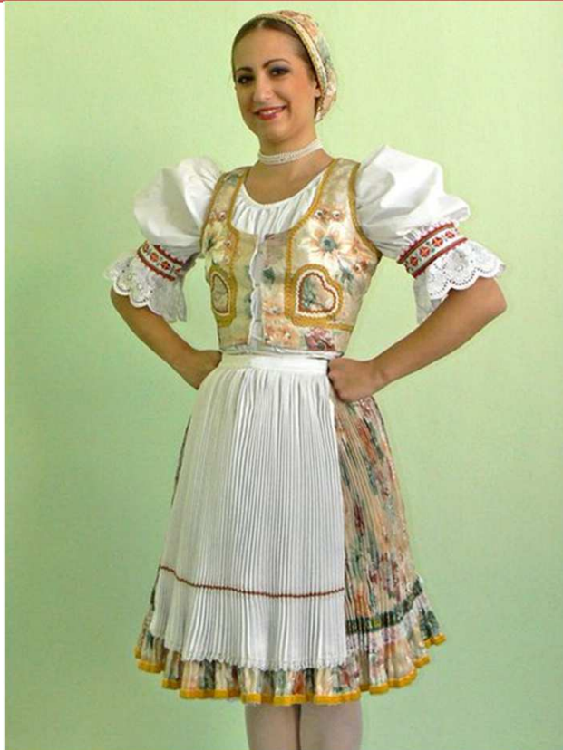
Zemplínsky kroj vydatej ženy