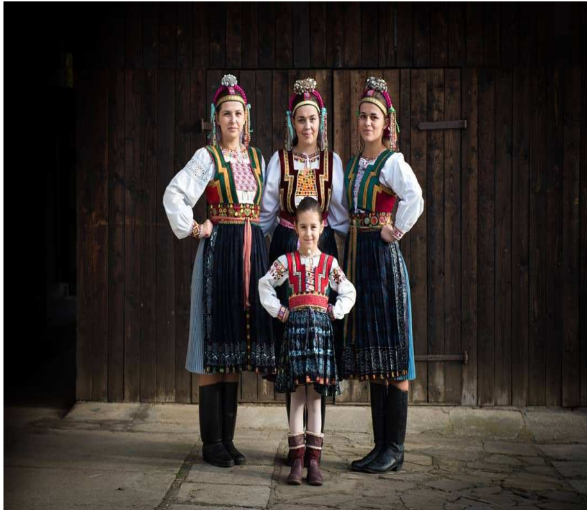
Ľudový kroj slobodných dievčat Torysky