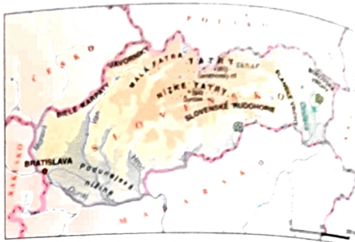
LEGENDA K FYZIKOGEOGRAFICKÝM MAPÁM

Slovensko je rozlohou menší štát. Preto aj rozdiely v podnebí neovplyvňuje geografická šírka, ale v oveľa väčšej miere nadmorská výška a vzdialenosť od Atlantického oceánu. Slovensko leží v miernom podnebnom