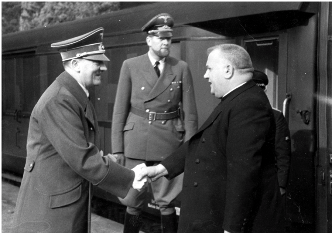
J. Tiso si podáva ruku s A. Hitlerom pri návšteve Berlína 1. októbra 1941.