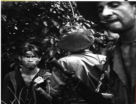
Francúzski legionári vo vojne v Indočíne