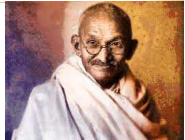
Mahatmá Gándhí (1869 – 1948) politický vodca indického ľudu v boji za nezávislosť