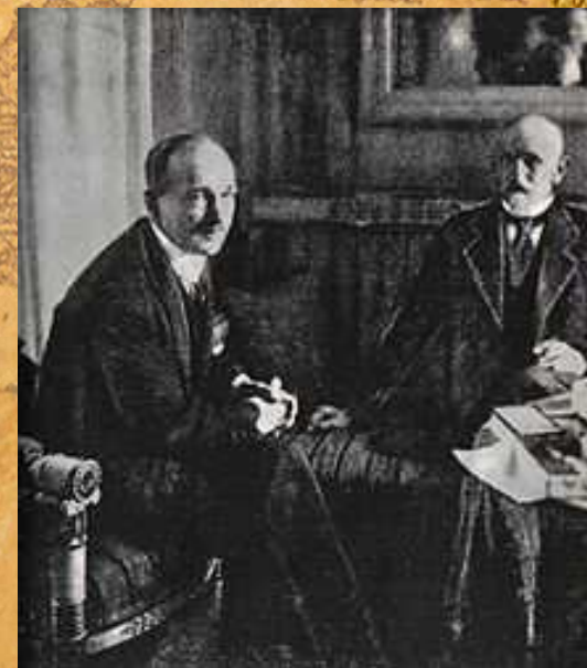
Edvard Beneš s T. G. Masarykom (1. prezident ČSR)

LA TCHÉCOSLOVAQUIE (28. 10. 1918 - 15. 9. 1938)