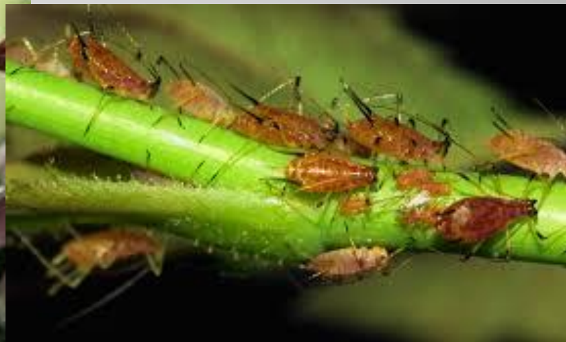
Vlnačka krvavá - voška