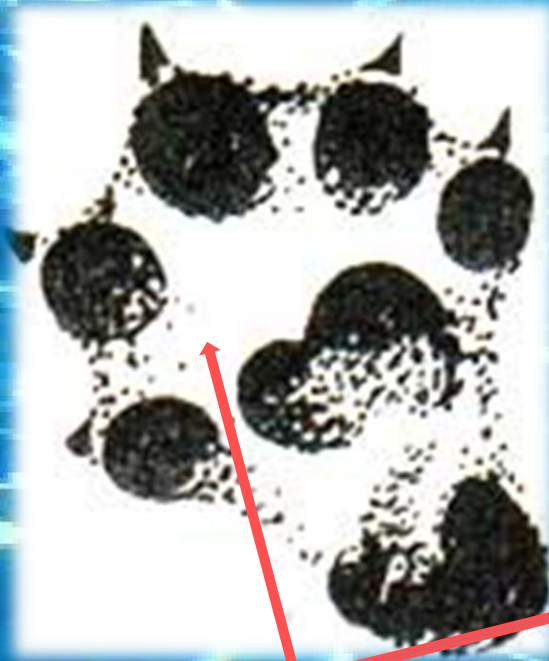
stopa prednej končatiny