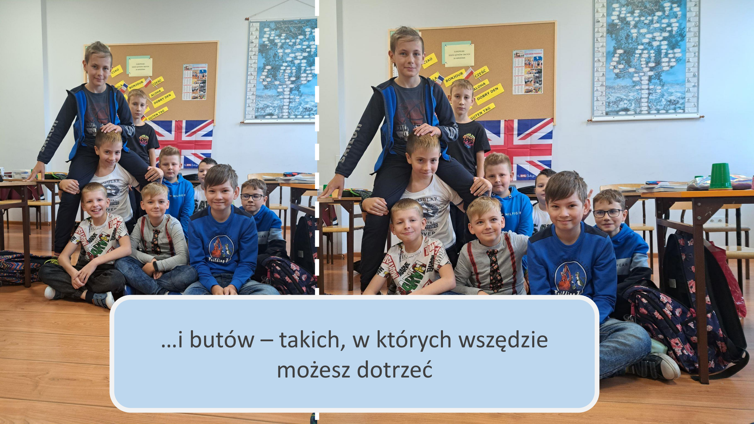
...i butów – takich, w których wszędzie możesz dotrzeć